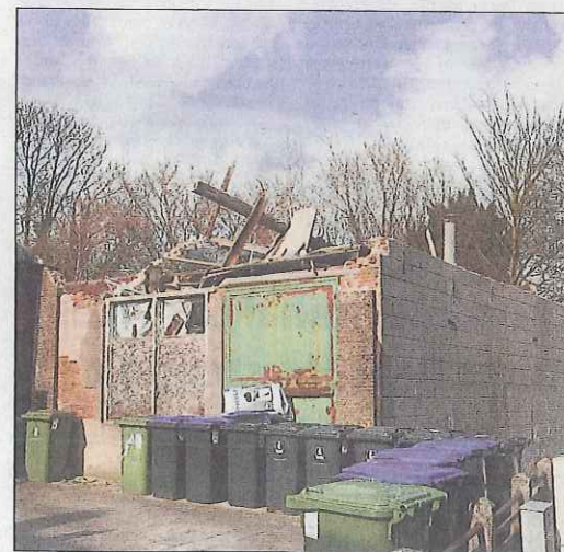
De oude zoutziederij in Hulst is een ander pand waarvoor het gemeentelijk monumentenbeleid te laat komt.

Deze lijst is echter nog niet compleet. De oudheidkundige kring en SBSH zijn bezig een volledige inventarisatie te maken. Zij beoordelen alle objecten in de gemeente afzonderlijk op hun cultuurhistorische waarde en dat vergt veel tijd. Zodra alle voorstellen zijn ontvangen, wordt de inventarisatielijst afgesloten. Dan worden de voorgedragen objecten - na eventuele voorselectie - door cultuurhistorisch onderzoek gerangschikt op waarde. In principe wordt uit iedere kern het object met de hoogste waardering geselecteerd als gemeentelijk monument. Uiteraard worden de eigenaren van die objecten voortijdig geïnformeerd over de voortgang en over de voor- en nadelen van vermelding op de gemeentelijke monumentenlijst.